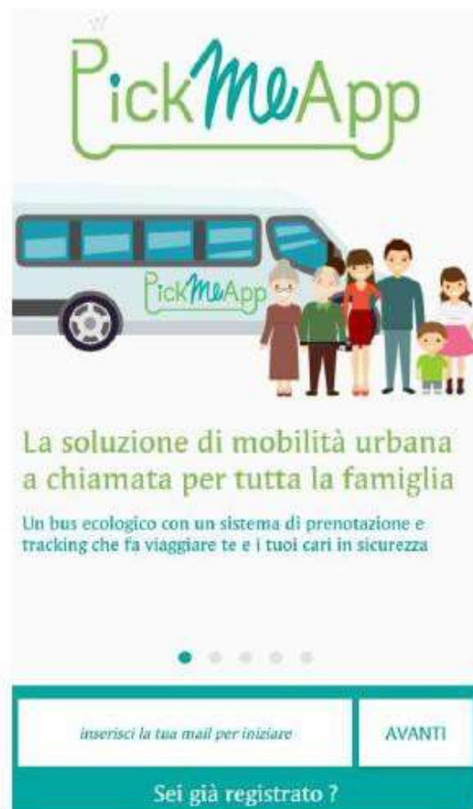
Fig. 1: Schermata iniziale dell'app