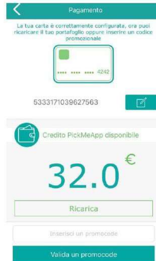
Fig. 4: Portafoglio virtuale