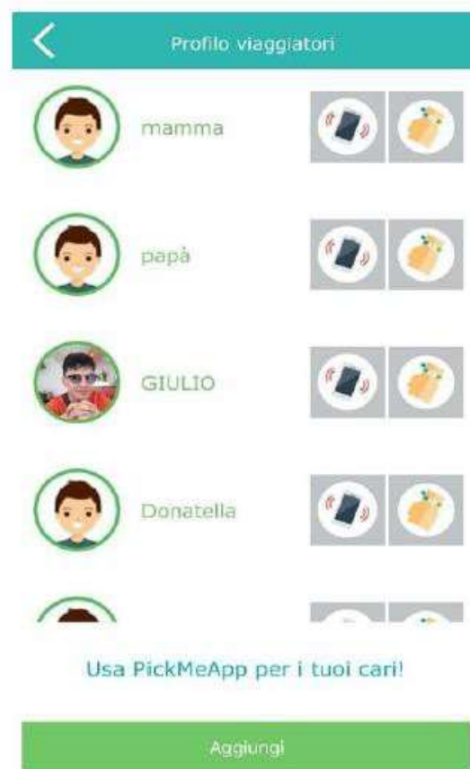
Fig. 3: Profila viaggianti